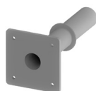
Guaina in acciaio con scorrimento laterale SL20